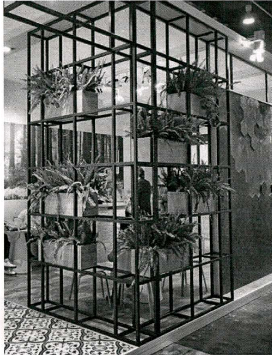
METAL PARTITION FOR OPEN EXECUTIVE CABIN