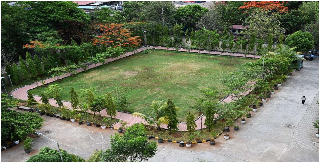
जॉगिंग ट्रैक/JOGGING TRACK