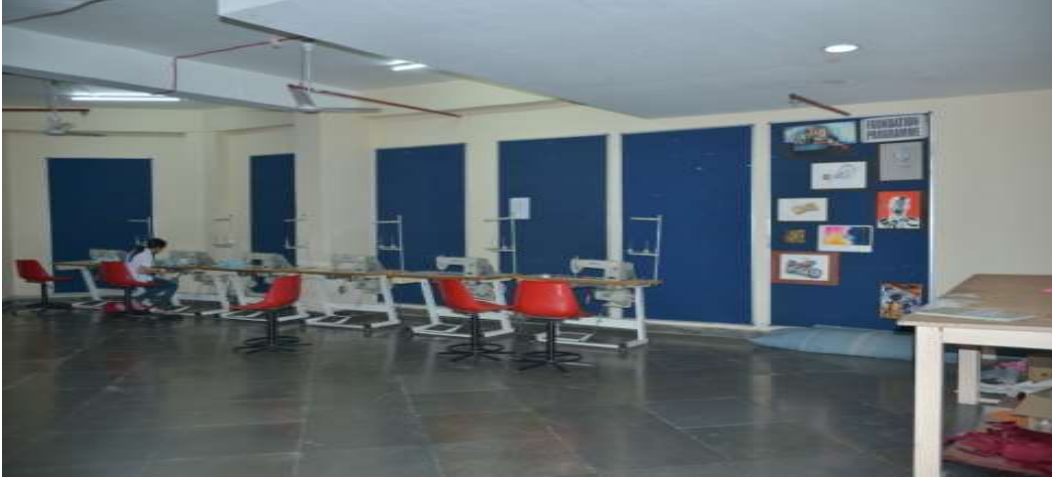
सिलाई मशीनें और मनोरंजन कक्ष SEWING MACHINES AND RECREATION HALL