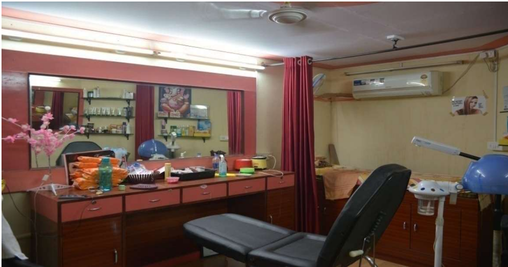
ब्यूटी पार्लर/BEAUTY PARLOUR