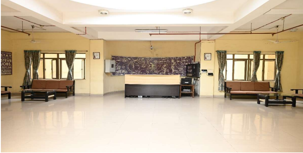
स्वागत क्षेत्र/RECEPTION AREA

room, 24 hours hot/cold water facilities, Gymnasium, Beauty Parlour(On payment basis), Mini Library, free Wi-fi facility, Automated Laundry Machines/IOT based Smart Laundry facility proposed (on payment basis)and Mess with 24 X 7 security arrangements with CCTV Surveillance. In house Assistant Hostel Warden is available, Doctor & Counselor are also available to address all the issues & concerns of hostlers.