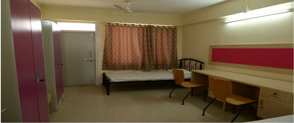
द्विछात्राओं वाला कक्ष/TWIN-SHARING ROOM