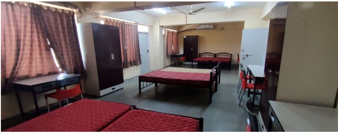
एसी डोरमेटरी/AC Dormitory