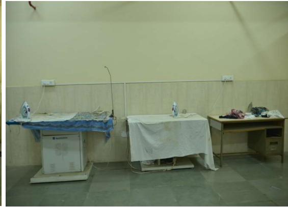
धुलाई का स्थान/LAUNDRY AREA