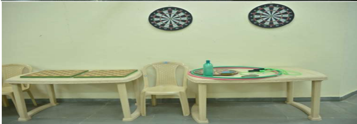
व्यायामशाला और इनडोर खेल क्षेत्र GYMNASIUM AND INDOOR GAMES AREA