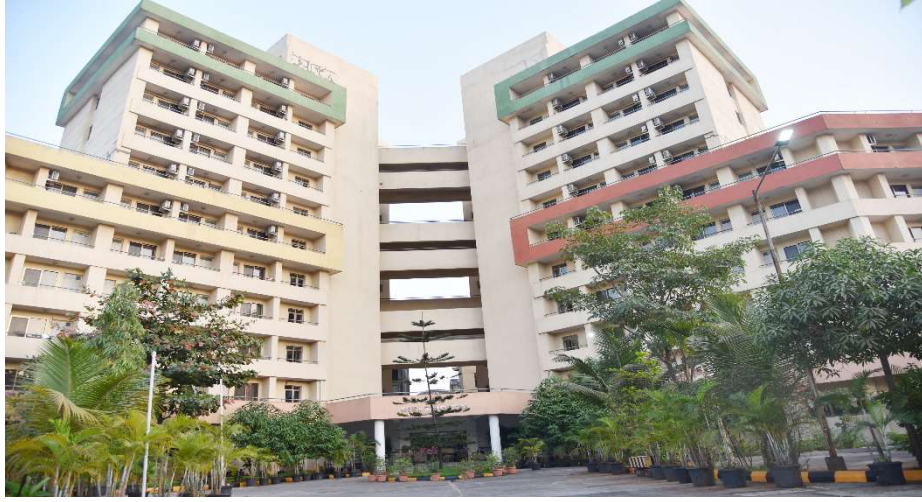
छात्रावास परिसर HOSTEL CAMPUS