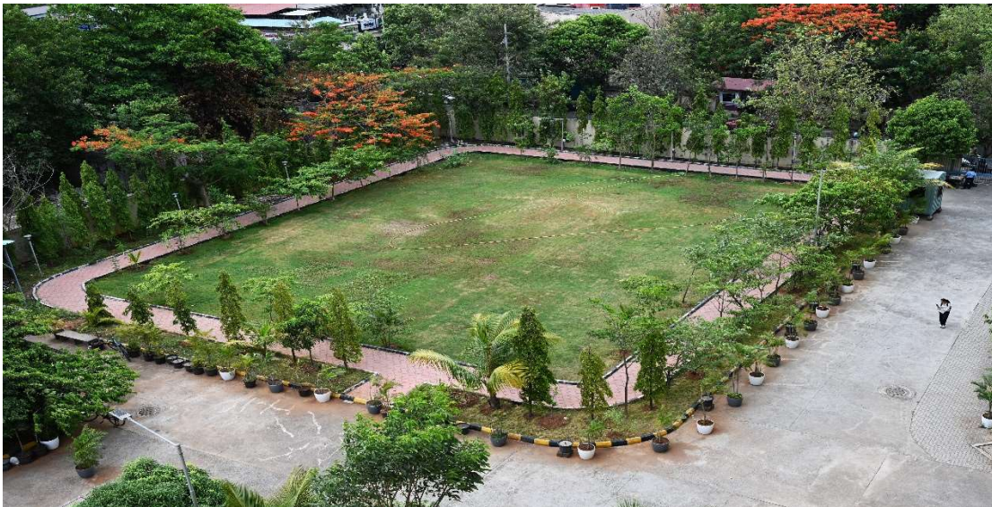
जॉगिंग ट्रैक/JOGGING TRACK