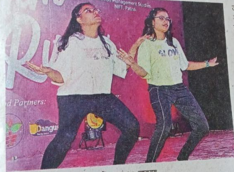
प्रतियोगिता में नृत्य की प्रस्तुति करती छात्राएं।