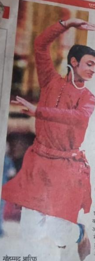
मिटी रिक्टर / पटना

डांस या सिर्फ बिहारी ने अंग्रेजों के का डौलवा देती है, बल्कि इस दिन कुछ नया करने की इच्छा देती है। बिहार में ऐसे तो कई नृत्य प्रदर्शन में हैं, लेकिन यहाँ के बच्चों में कथक और भरतनाट्यम का सम्बन्ध अधिक क्रेज है। बिहारी कुछ सालों में यहाँ के युवाओं ने कथक और भरतनाट्यम के माध्यम से अपनी पहचान बनाई है। इन युवाओं को कथक और भरतनाट्यम सीखने के लिए समाज के तानों से लेकर कई तरह की मुश्किलों का सामना करना पड़ा है। वह इस साल प्रथममंजरी के सामने अपने नृत्य को प्रस्तुत कर चुके हैं। इसके अलावा उनका सैलैब्रेशन स्पिक मैके के गुरु-शिष्य प्रोग्राम में हुआ है। वह अंतरराष्ट्रीय स्तर पर अपनी पहचान बना चुके हैं।